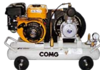
エンジンレシプロコンプレッサー