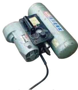
ハンディーコンプレッサー

構造の簡単なレシプロタイプなので軽量で高圧のエアを供給することができます。 各種工具、塗装、気密テストなどに