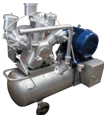
15馬力レシプロコンプレッサー