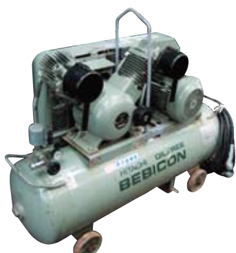
5馬力レシプロコンプレッサー