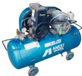
100Vベビーコンプレッサー