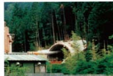
坑口周辺環境が良化