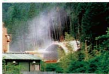
坑口から粉塵が流出