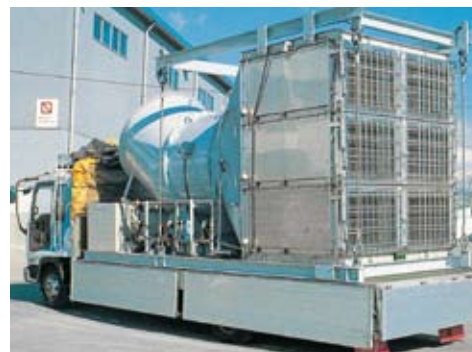
FY-20TKE 2000m 3 /minタイプ