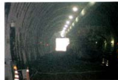
粉塵を高効率で除去