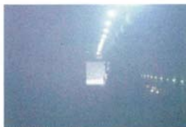
坑内は粉塵が蔓延