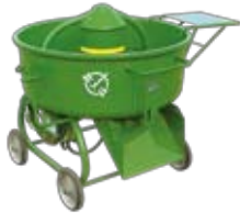
3.5 切モルタルミキサー