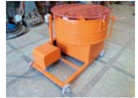
8 切モルタルミキサー