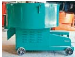
6 切モルタルミキサー