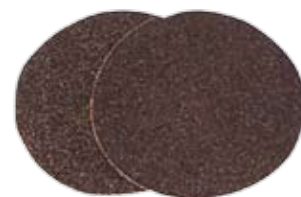
マシンペーパー # 24