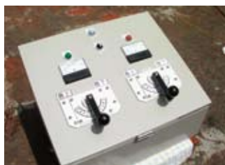
〔2台同期遠隔操作盤〕