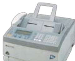
業務用ファクシミリ

原稿サイズ (A3最大306mm幅×900mm) 有効読取サイズ (A3 (300mm幅)) 記録紙サイズB4/A4 電送時間 約6秒 記録方式 熱転写記録方式/感熱記録方式