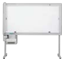
OAボード ※記録用紙・インク等は別途料金となります。

原稿サイズ (A3最大306mm幅×900mm) 有効読取サイズ (A3 (300mm幅)) 記録紙サイズB4/A4 電送時間 約6秒 記録方式 熱転写記録方式/感熱記録方式