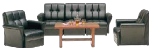
応接セット (応接テーブルW900×D440×H470mm) (左肘W710×D760×H690mm) (右肘W710×D760×H690mm) (肘無W560×D760×H690mm) (両肘W860×D760×H690mm)