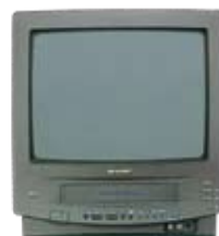
ビデオ内蔵TV14型 DVD付もあります。