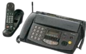
家庭用ファクシミリ

原稿サイズ (最大257mm幅×1000mm) 有効読取サイズ (B4 (252mm幅)) 記録紙サイズB4/A4 電送時間 約15秒 記録方式 感熱記録方式