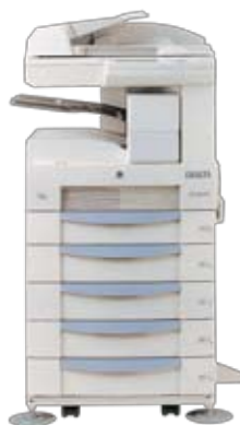
デジタルコピー (コピー・FAX・プリンター付複合機) (W609×D720×H888mm)

販売商品 ・各種プリンター ・接続ケーブル ・ネットワーク関係機器 ・その他周辺装置 ・アプリケーションソフト ・プリンター用インク ・トナーカートリッジ