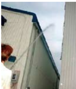
遠投能力 垂直8m 最大13m