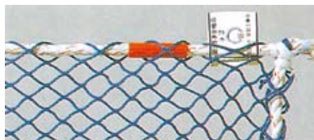
防災ラッセルネット (18mm目合い)